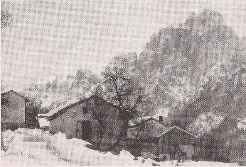
COSTASACCHETTO (VAL DOGNA) in una suggestiva immagine invernale