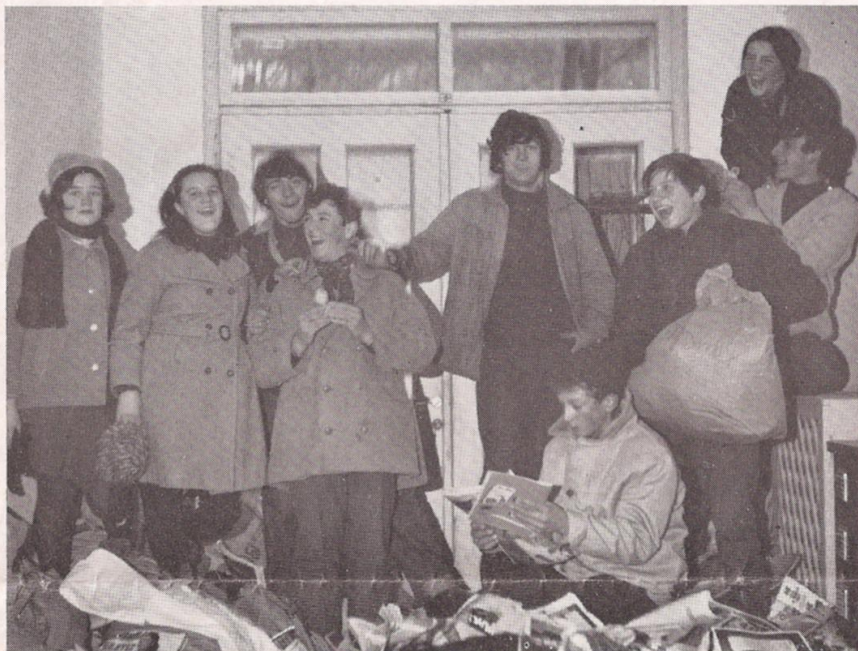
Non è mancata fatica a raccogliere carta e stracci per i lebbrosi ma non manca il buon umore e serenità fra i volenterosi.