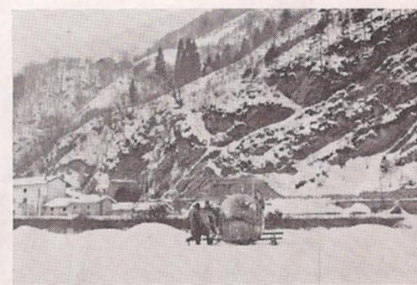
8 marzo 1970. Mezzi di trasporto moderni intervenuti a soccorrere i valligiani di Chiout, nella nevicata eccezionale.

ti raggiunti da un elicottero delle truppe Carnia che ha portato pane e medicinali ed un medico militare per visitare alcuni ammalati. La situazione è andata poi normalizzandosi con l'apertura della strada.