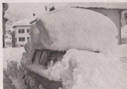
La macchina del parroco «sottocoperta»

Le frazioni di Chiout, Chiutzuquin e Pleziche sono rimaste isolate per quasi una settimana. Gli spazzaneve le ruspe hanno lavorato in continuità per aprire un passaggio nel manto nevoso di un metro e mezzo che copriva queste località. Nella domenica successiva, 8 marzo, gli abitanti delle tre frazioni sono sta-