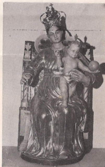
Così si presenta ora la statua della B.V. del Rosario dopo il restauro eseguito nei mesi scorsi. L'effigie che sembra risalire al 1700 era stata restaurata nel 1858.