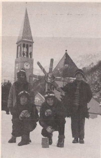
I chierichetti di Dogna fedeli alla tradizione hanno fatto il loro giro per la raccolta dei «siops».

I frazionisti di Saletto hanno ben volentieri messo da parte lampade a petrolio e candele per godere di una più moderna forma di illuminazione attraverso l'energia elettrica. Attesa da anni è arrivata in questi giorni attraverso un moderno elettrodotto messo a punto dall'ENEL. Gli abitanti di Saletto sono grati a tutti coloro che hanno portato avanti la loro giusta causa.