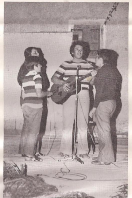
The Folks Fella Blues nella loro prima esibizione