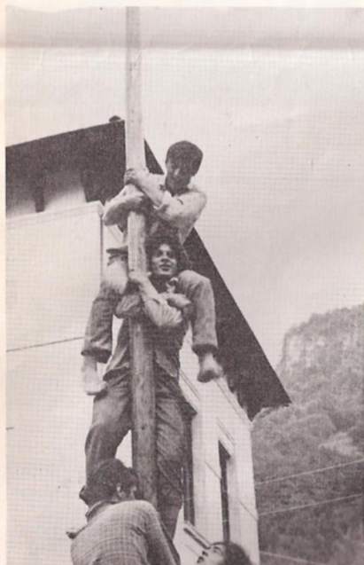
Palo della cuccagna... quasi in cima

L'unione ed il sacrificio di tanti che hanno collaborato è stato premiato da un successo riconosciuto anche dai molti forestieri intervenuti alle varie manifestazioni. Anche a loro e a tutti quelli che ci hanno dimostrato la loro simpatia giunga il nostro grazie per averci onorati della loro presenza.