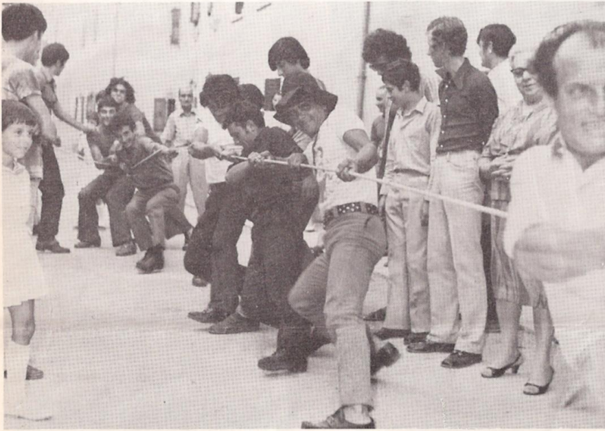
Tiro alla fune... le migliori forze in azione

Le prime note di musica escono dagli altoparlanti posti lungo la strada principale del paese; è l'inizio della consueta sagra di S. Lorenzo. Si respira aria di festa: i primi « pescatori » escono dalla sala con i regali in mano, alcuni soddisfatti, altri insoddisfatti; anche quest'anno ce n'erano per tutti e per tutti i gusti, bastava un pizzico di fortuna.