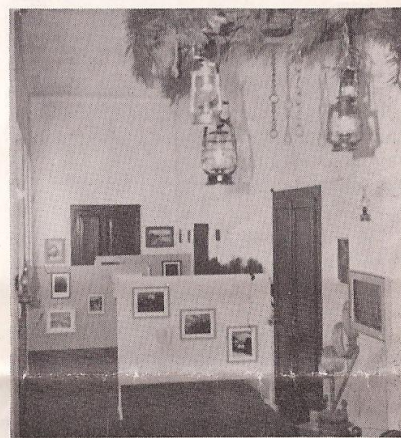
Uno scorcio della Mostra di pittura e fotografia