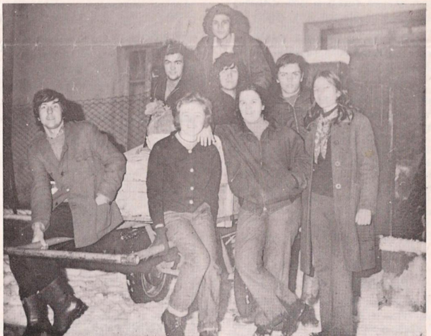
Un momento di sosta per la foto ricordo. Non manca sul volto un sorriso di soddisfazione.