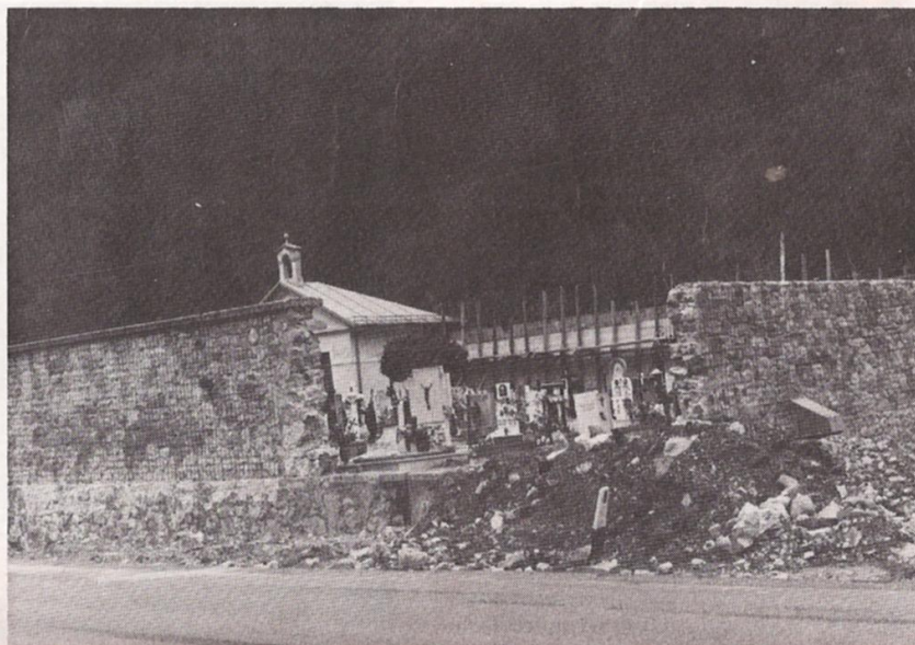
I lavori di restauro della cinta muraria del cimitero.