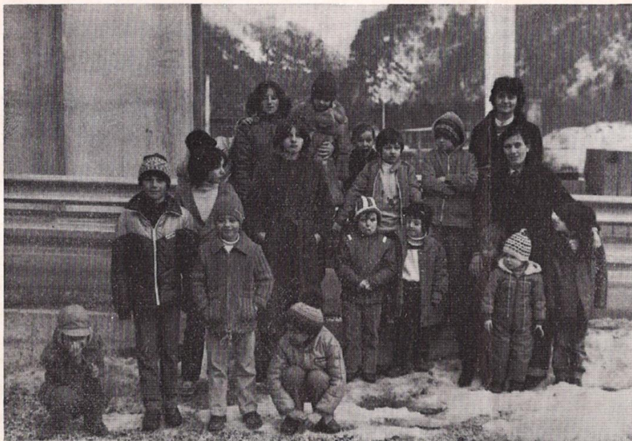
Le catechiste con alcuni dei bambini partecipanti alla festa del 7 febbraio.