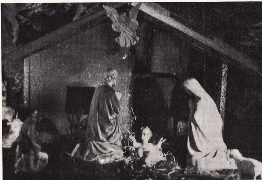
La devozione a Maria è il mezzo di avvicinarci a Gesù.