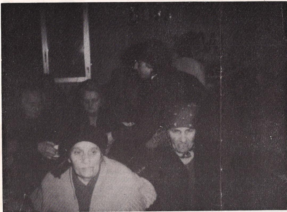
Foto molto significativa anche se non ben riuscita il 7 dicembre 1981 al Centro Sociale: un allegro momento con i nostri vecchietti per gli auguri natalizi.