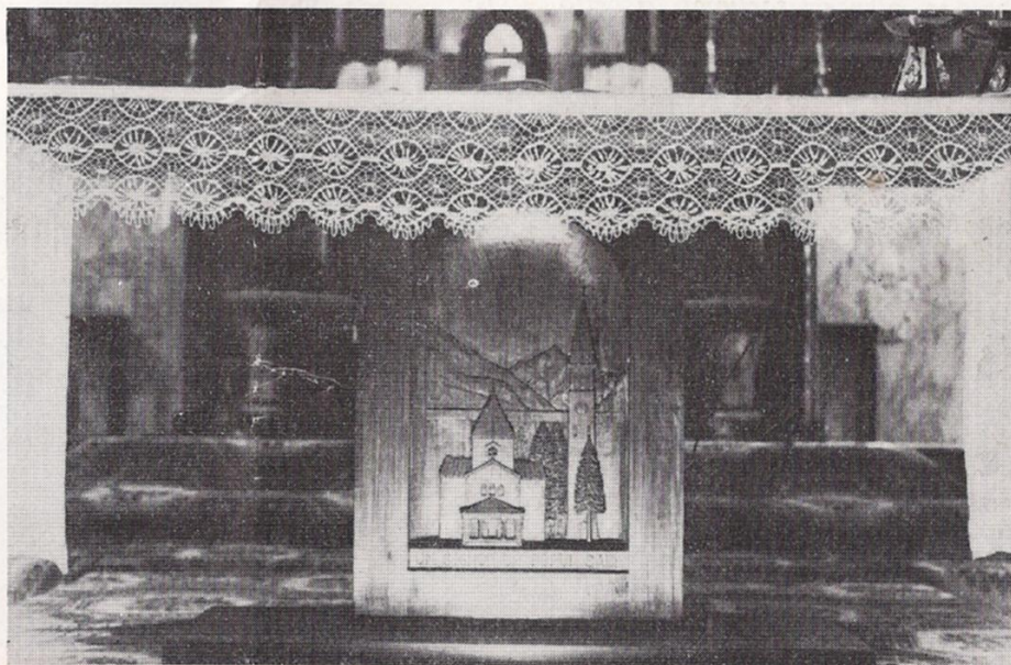
Il nuovo altare della nostra chiesa.

AI SOFFERENTI, AI LONTANI GIUNGA SINCERO L'AUGURIO DI BUONA PASQUA