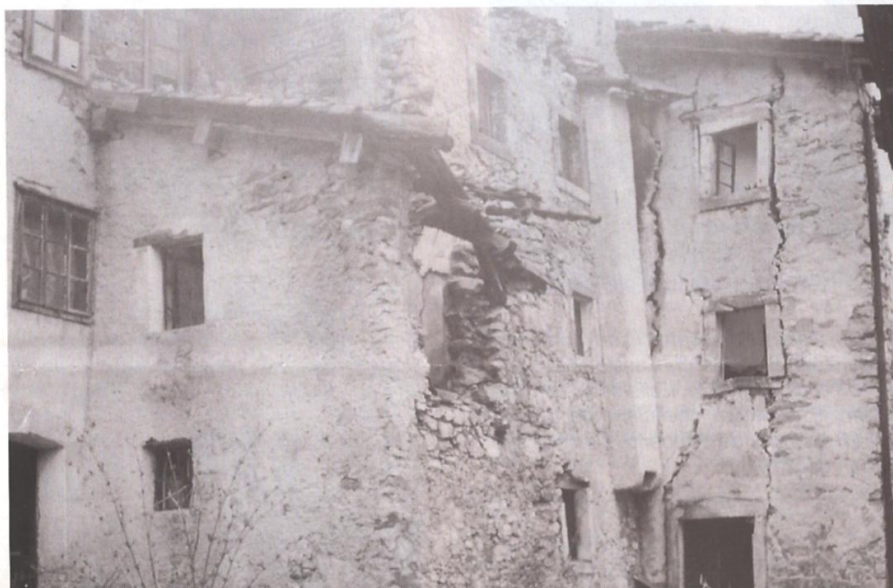
La casa dei Cocons segnata dal tempo e dall'abbandono...