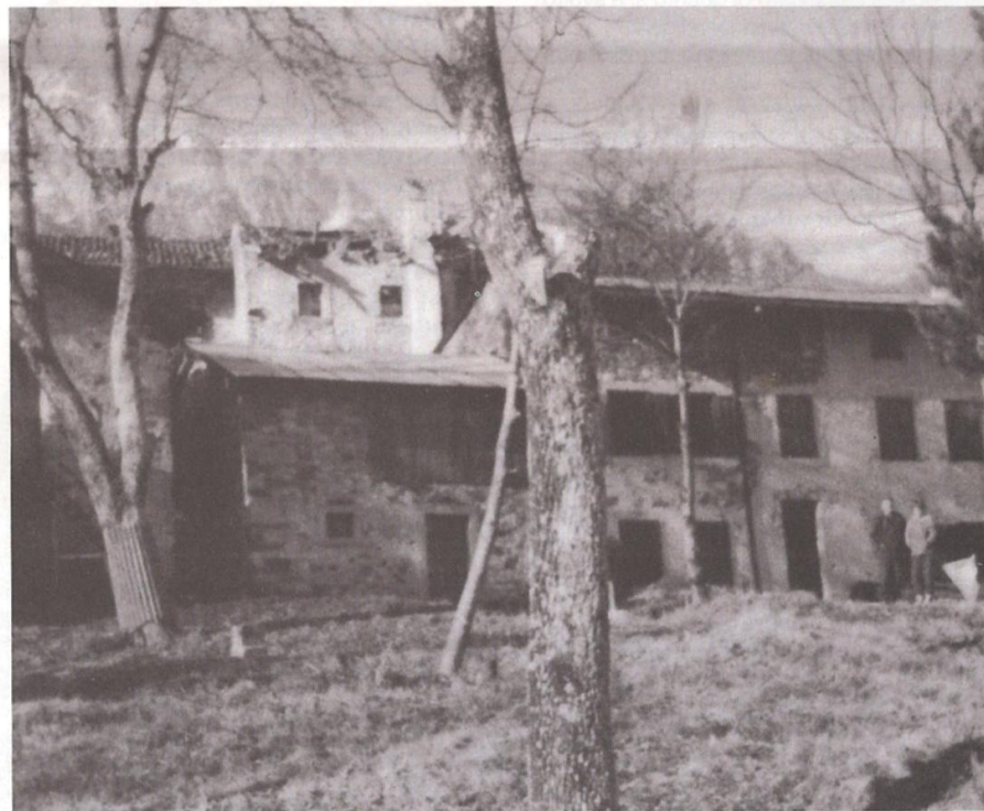
...quella del Vigjut invece sopravvive.