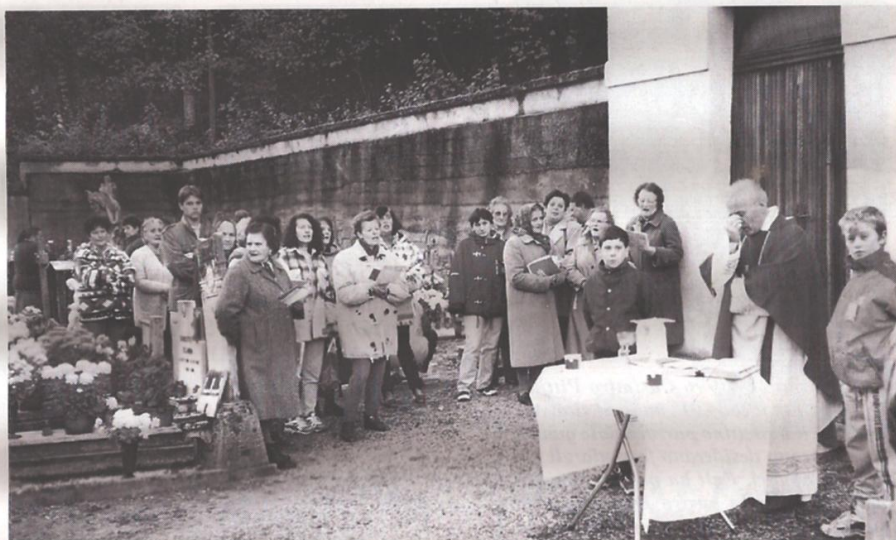
2-11-96. Pre Tonin al dis messe par duc' i muarz.