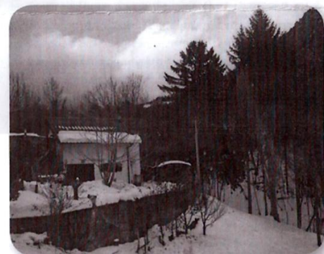
La casetta di Simone

"Per me è sempre un'emozione recarmi nel piccolo borgo dove ho visto mio nonno, con ingente sacrificio, iniziare e portare a termine la costruzione della stalla; l'ho guardato posare mattone su mattone incurante della fatica e della stanchezza pur di portare a termine il suo progetto. L'idea gli è nata dopo andato in pensione essendosi trovato con più tempo libero da poter dedicare ai suoi interessi. Penso sia stata una buona idea la sua perché ora, sinceramente, non riesco ad immaginarmelo seduto sempre sul divano. Lassù ha le sue bestiole che gli danno un continuo lavoro e lo obbligano ad andare su ogni giorno. Pure io mi reco ogni giorno in Galiscis, dopo l'impegno mattutino della scuola, a prendere una boccata d'aria sicuramente un po' più pura di quella del paese. A volte qualcuno mi chiede: "Cosa ci trovi in Galiscis?", io in realtà non trovo risposta se non quella di un affetto personale essendomi legato, fin da piccolissimo, in maniera stretta a quel luogo, sebbene ricco di storia solo per me.