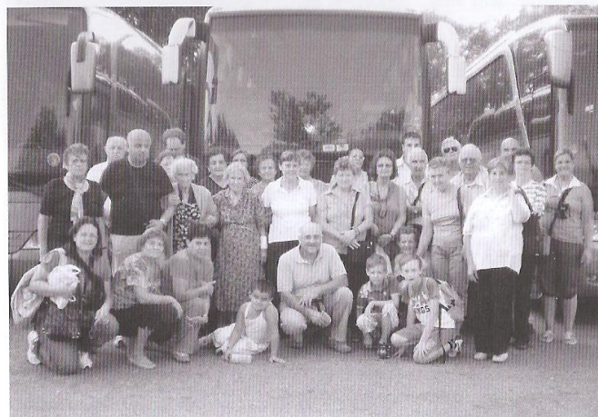
I partecipanti posano per la foto ricordo