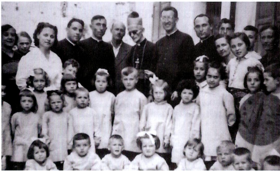
Pittini in una visita a Dogna - anno 1951

Continuiamo a leggere la vita avventurosa del nostro Riccardo Pittini, dognese nato alla fine del 1800 a Tricesimo. Lo abbiamo lasciato, nella scorsa puntata, al momento della sua consacrazione sacerdotale, nel 1899. La sua vita è narrata nella sua autobiografia "Memorie Salesiane di un Arcivescovo cieco".