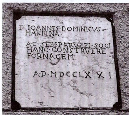
Foto 1: Iscrizione murata in un edificio di Vidali che attesta la costruzione della fornace nell'anno 1771.

torrenti. Altro elemento utile per evitare che l'argilla si attaccasse alle formelle era la sabbia fine, che veniva distribuita sulle pareti dello stampo prima di porvi all'interno l'impasto, materiale presente in abbondanza lungo il Fiume Fella. Indispensabile la legna per la cottura che veniva procurata con gli stessi metodi utilizzati per la produzione della calce. Il lavoro incominciava all'alba ed erano soprattutto gli uomini ad