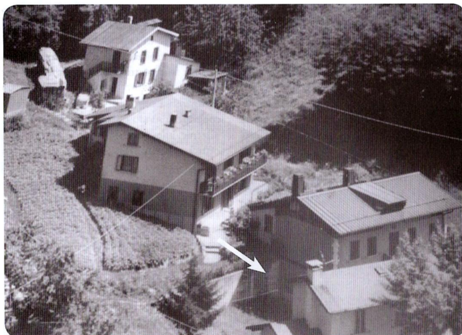
Il Balador visto da un elicottero. La freccia indica dov'erano le due case del racconto

vissuto a lungo in Francia come emigrante. Così qualcuno ha ricominciato a salire le scale, aprire la porta e le finestre e accendere il fuoco: era tornata la vita.